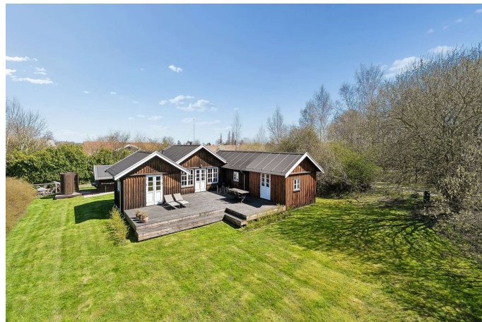
Set fra haven