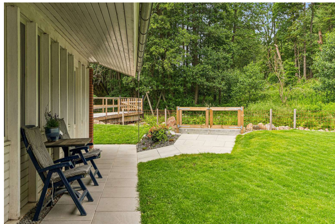
Set fra haven