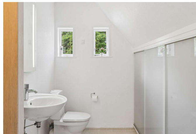
Badeværelse 1 sal.