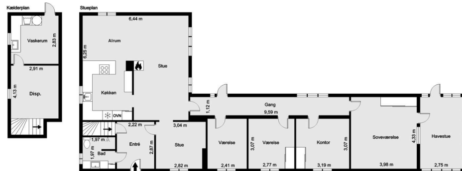
Vejledende tegning uden ansvar! (Profil.dk)