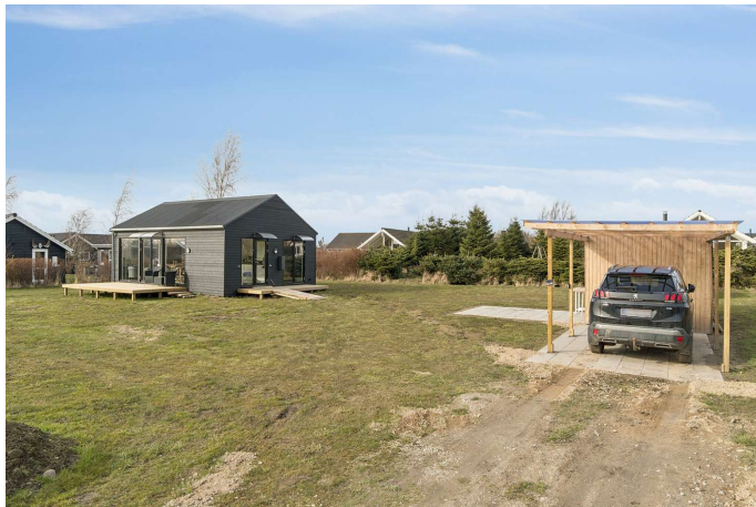
Set fra vejen