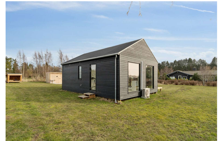
Set fra haven