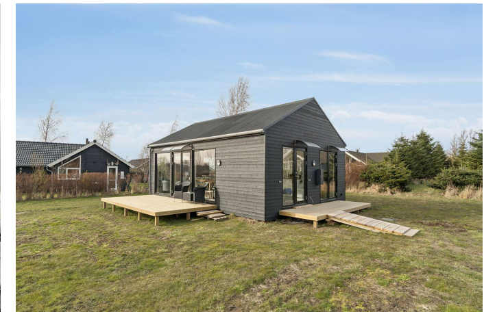
Set fra haven