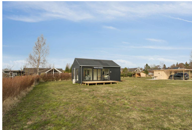
Set fra haven