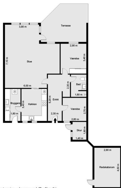
Vejledende tegning uden ansvar! (Profil.dk)