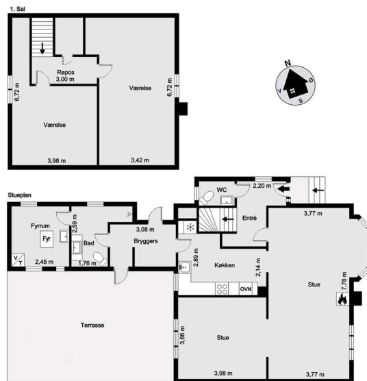
Vejledende tegning uden ansvar! (Profilim.dk)