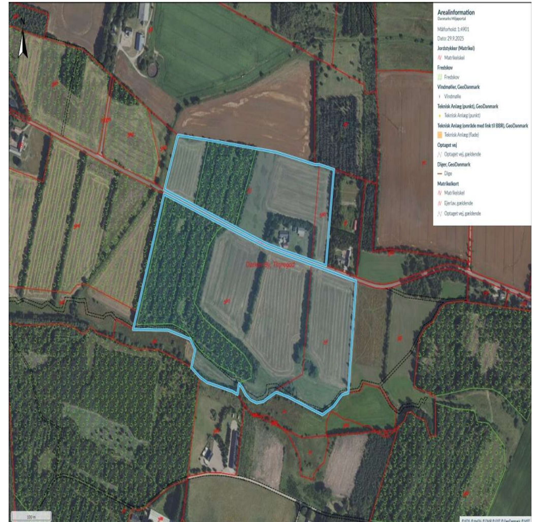
Kort over ejendommen

Vejledende tegning uden ansvar! (Profilm.dk)