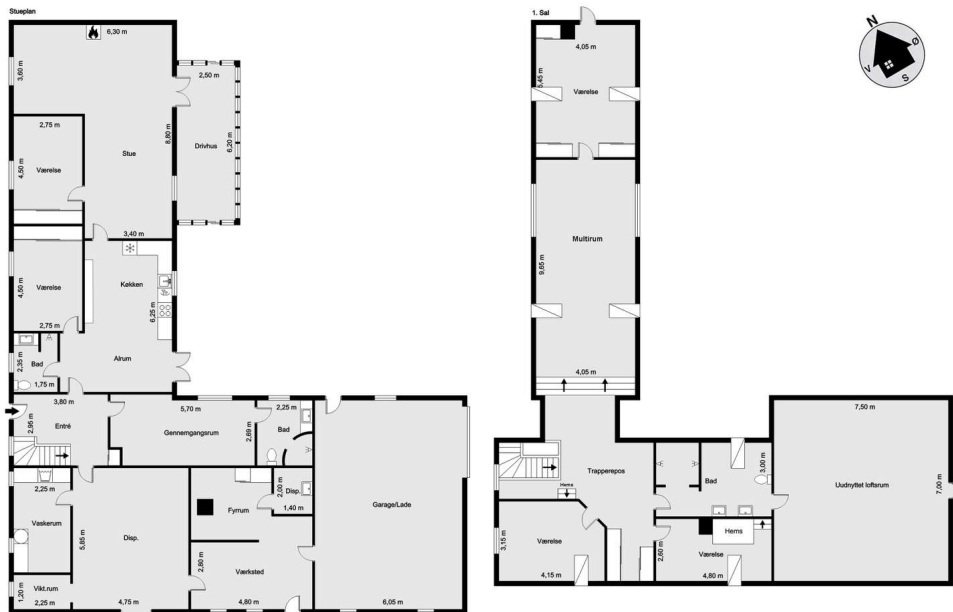
Vejledende tegning uden ansvar!