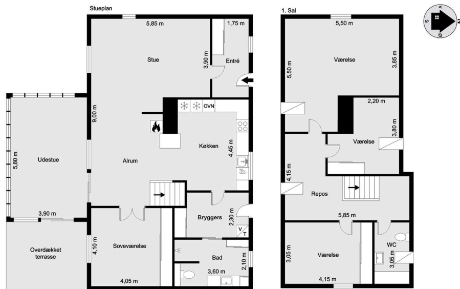
Vejledende tegning uden ansvar!