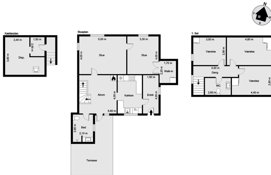
Vejledende tegning uden ansvar! (Profil.dk)