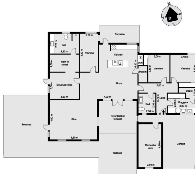
Vejledende tegning uden ansvar! (Profil.dk)