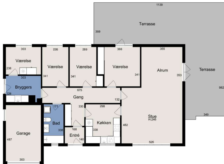
Vejledende tegning uden ansvar