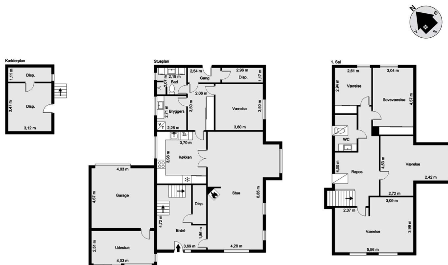
vejledende tegning uden ansvar!