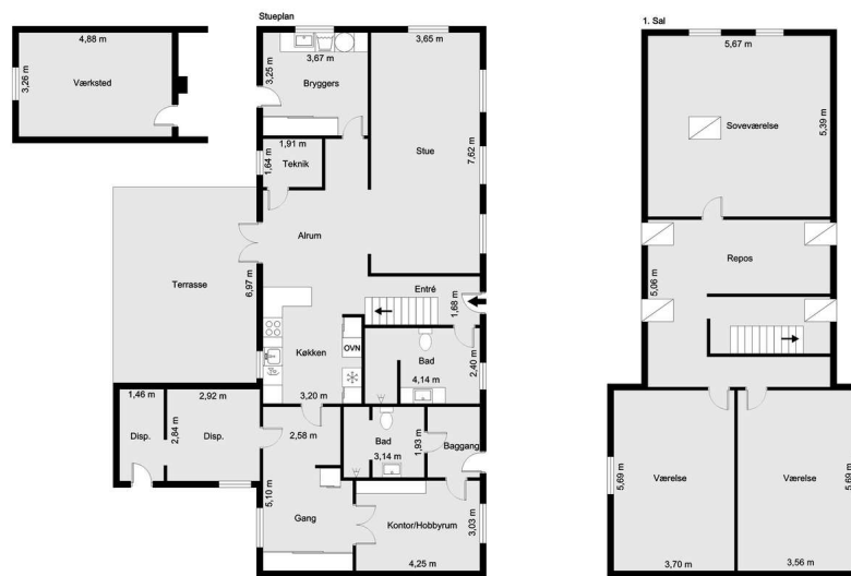
Vejledende tegning uden ansvar! (Profilm.dk)