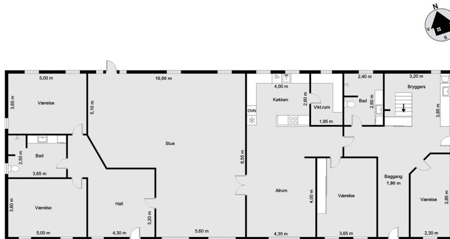
Vejledende tegning uden ansvar! (Profil.dk)