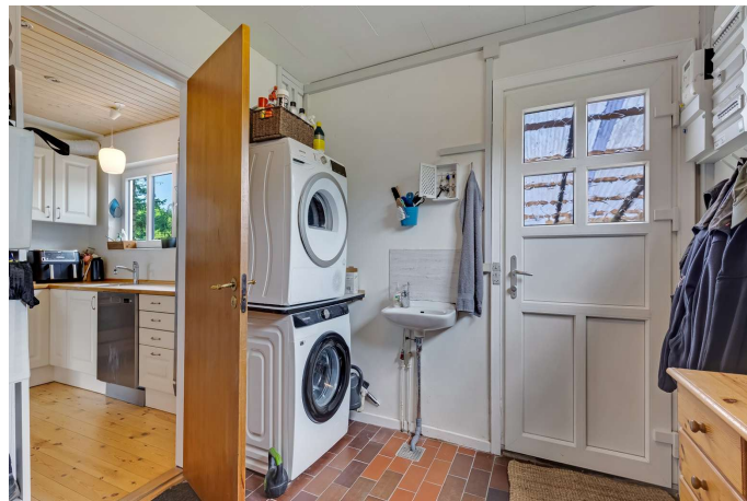
Bryggers med indgang fra carport