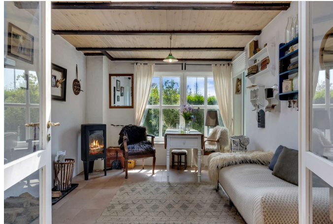
Stue med udgang til terrasse