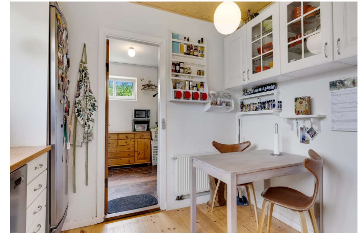
Køkken med spiseplads