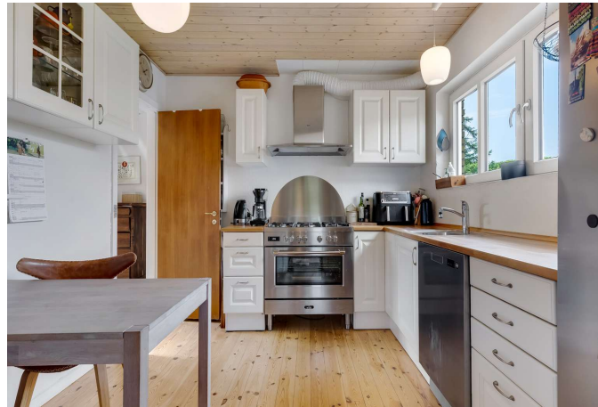
Køkken med spiseplads