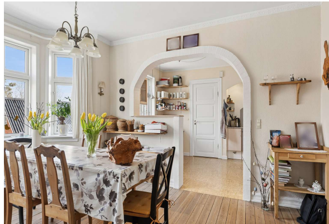
Køkken/alrum i åben forbindelse til hinanden.