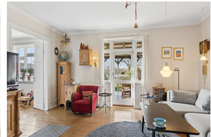
2 stuer en suite eller et ekstra værelse i stueplan.