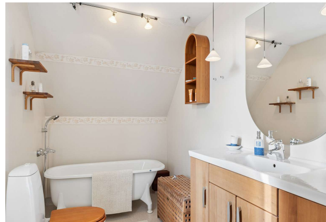
I alt 2 badeværelser