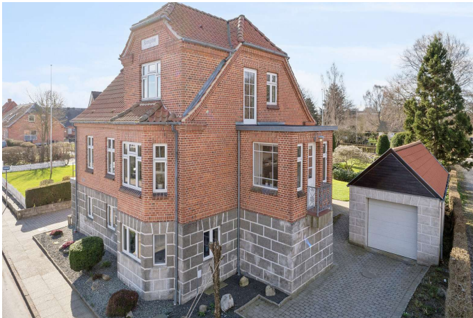
Charmierende hus med garage og skønneste have.