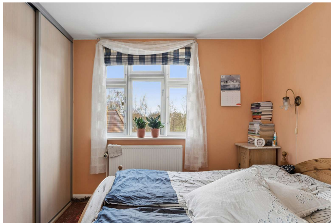
I alt 4 værelser samt gode disp. rum i kælderen.