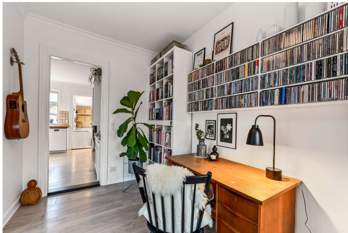
Kontor i åben forbindelse til stue