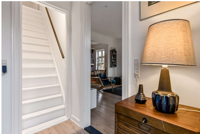
Trappe til 1. sal