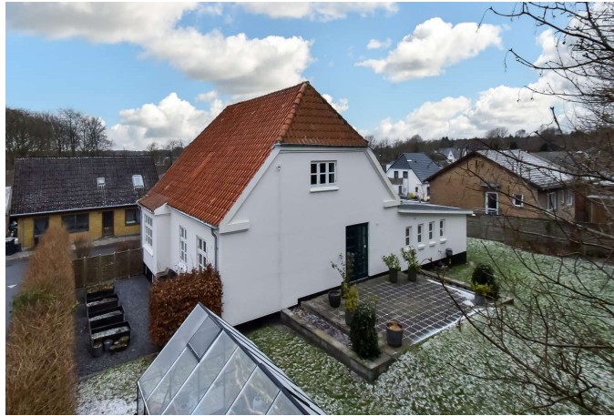
Ejendommen fra havesiden