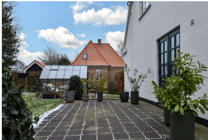
Terrasse & orangeri