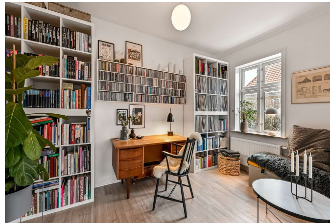
Kontor i åben forbindelse med stue