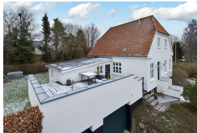
Terrasse over garagen