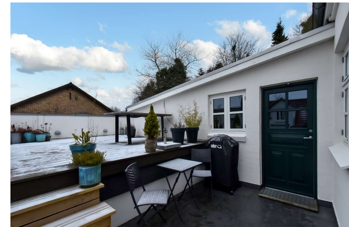
Terrassen over garagen