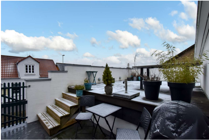
Terrassen over garagen