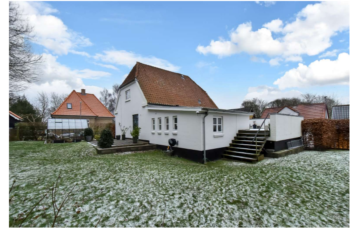
Ejendommen fra havesiden