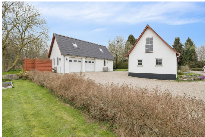
Set fra vejen