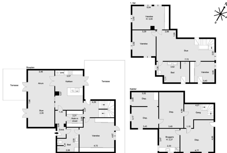
Vejledende tegning uden ansvar