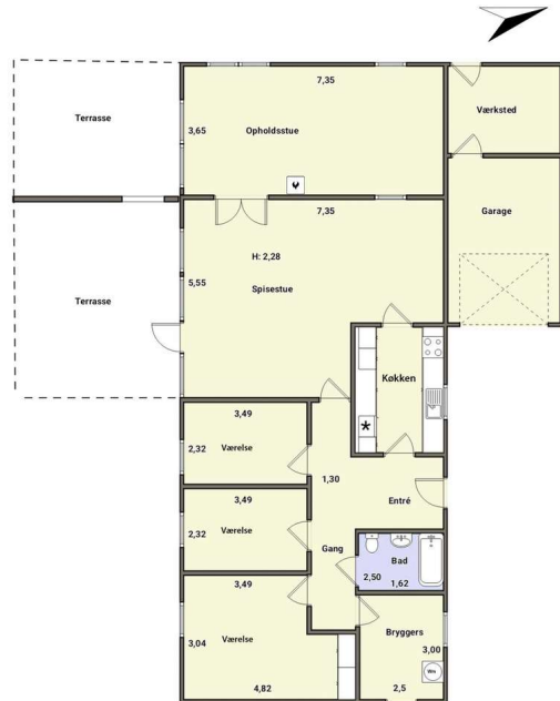
Vejledende plantegning uden ansvar