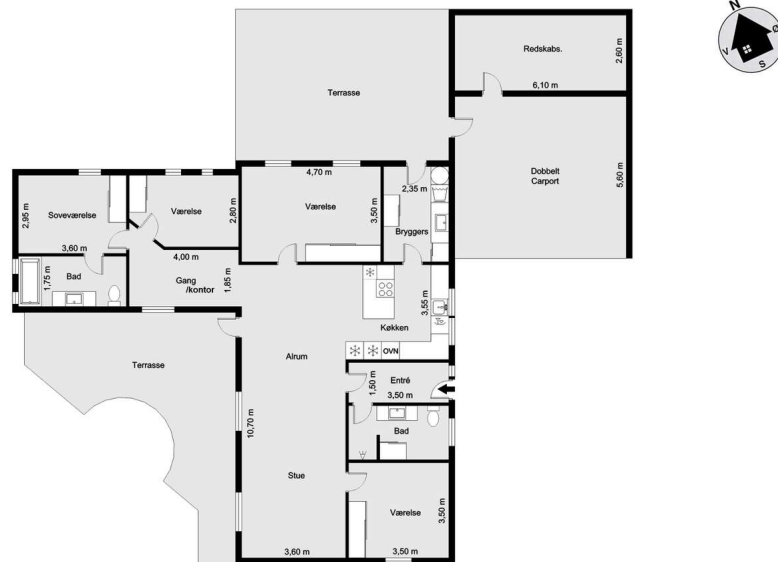
Vejledende tegning uden ansvar! (Profilm.dk)