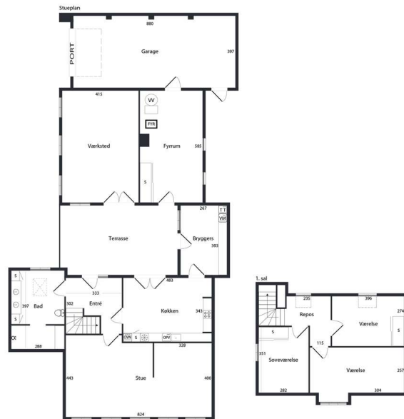
VEJLEDENDE PLANTEGNING UDEN ANSVAR SOU.FOTO-YN