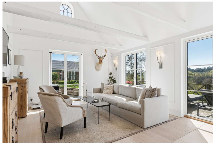
Loft til kip, synlige bjælker og gulvvarme.