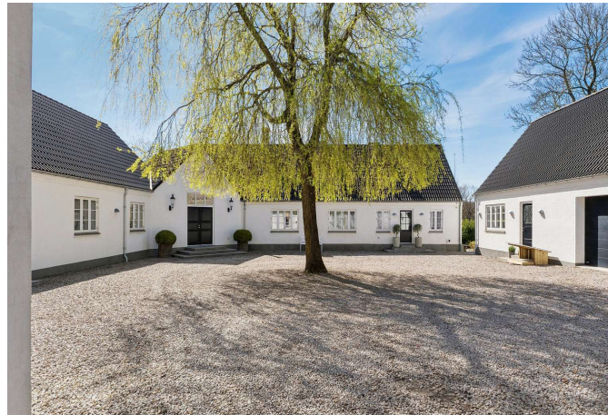
Ejendommen er total istandsat ude som inde.