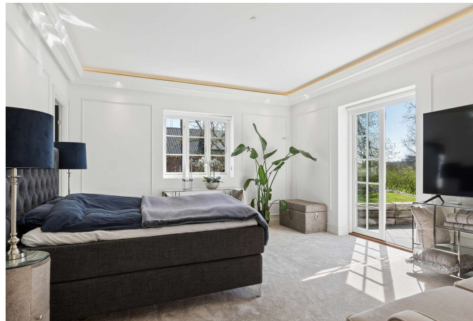
Soveværelse med walk-in og eget badeværelse.