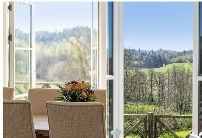
Fantastisk lysindfald og udsigt over landskabet.