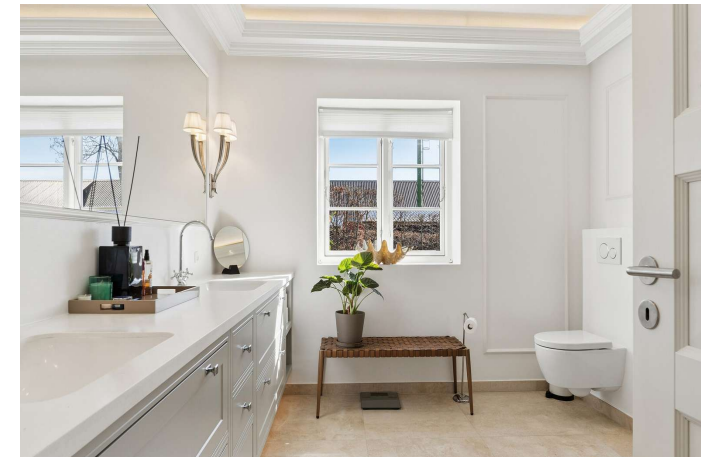
I alt 2 flotte badeværelser, i alt 3 toiletter.