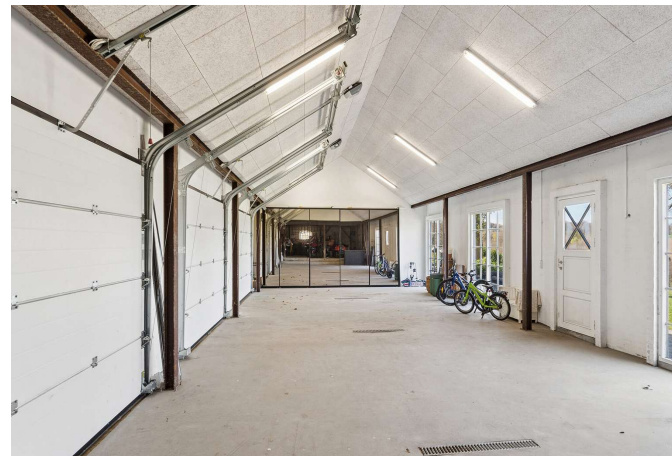
Gode udhuse, her tredobbelt garage.