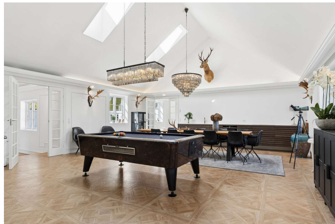
Stue/gildesal/aktivitetsrum med eget køkken.