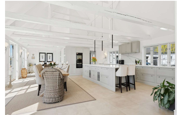
Stort køkken/alrum i åben forbindelse til stuen.