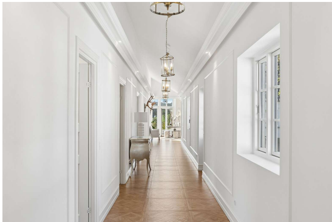
Værelsesafdeling med adgang til 3 gode værelser.