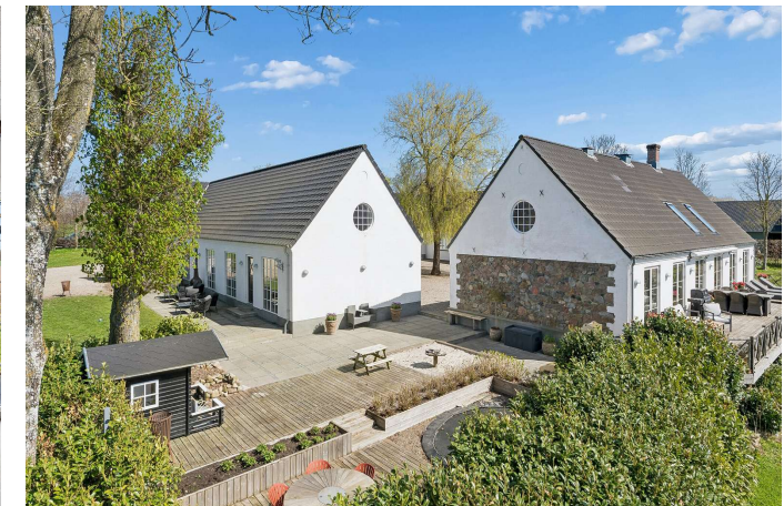
Fantastisk uderum og ialt 7,6 ha. jord.