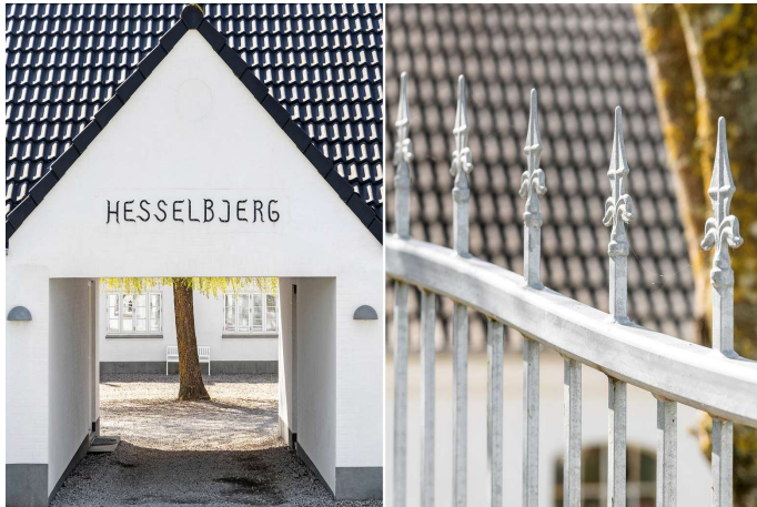
4-længet helt unik ejendom tæt på Bjerringbro