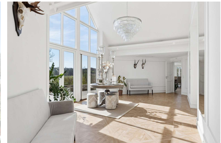
Stue/alrum/aktivitetsrum med fantastisk lysindfald.