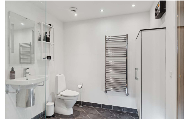
Badeværelse i underetage