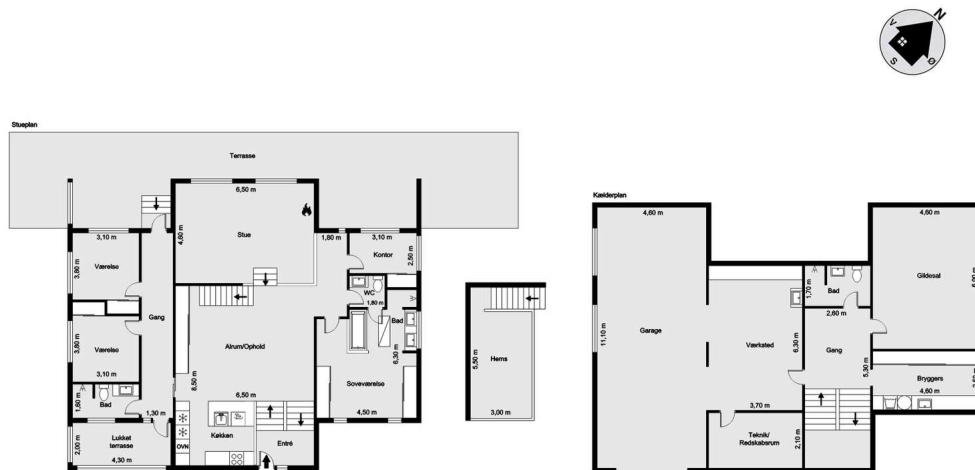
Vejledende tegning uden ansvar! (Profilim.dk)