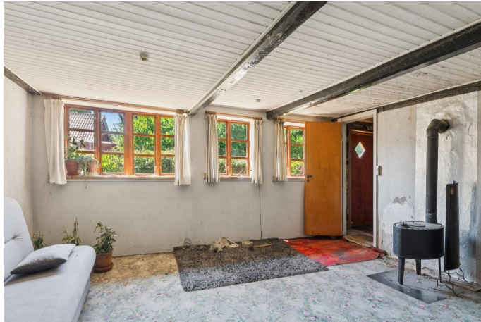
Stue med brændeovn