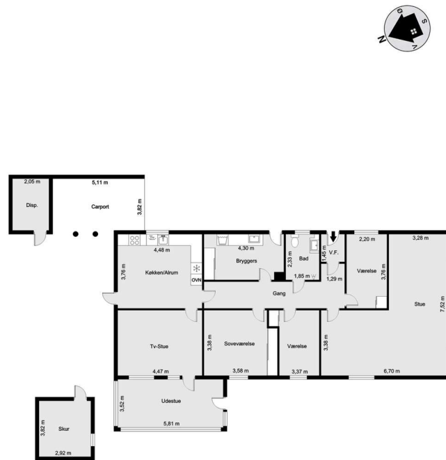
Vejledende tegning uden ansvar! (Profil.dk)