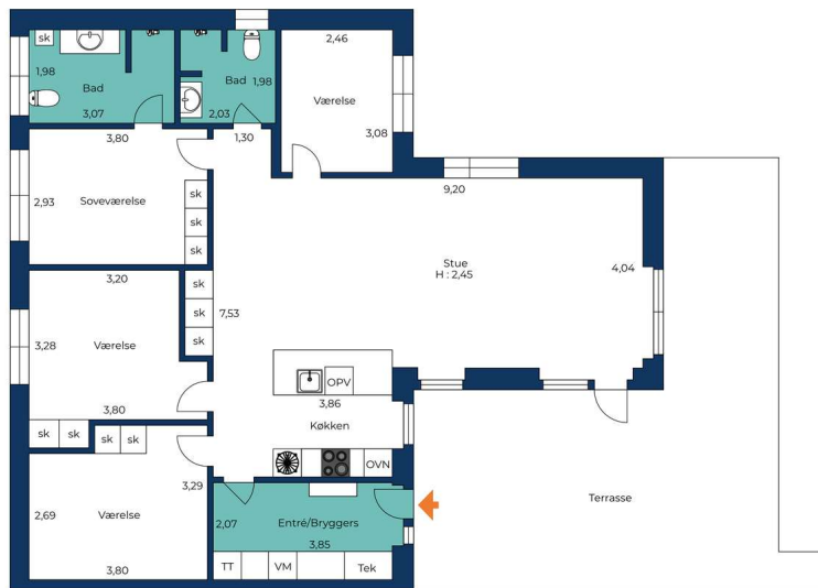
Vejledende tegning uden ansvar.