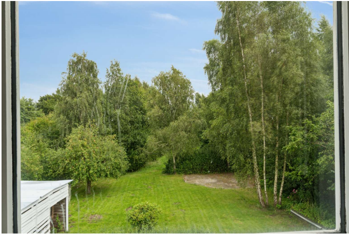
Udsigt til haven