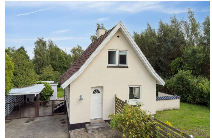
Set fra vejen