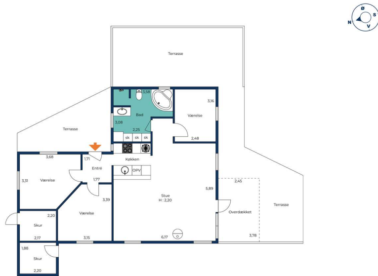
Vejledende tegning uden ansvar.