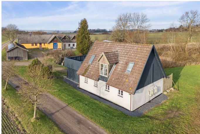
Gerlev Mose nr. 1B