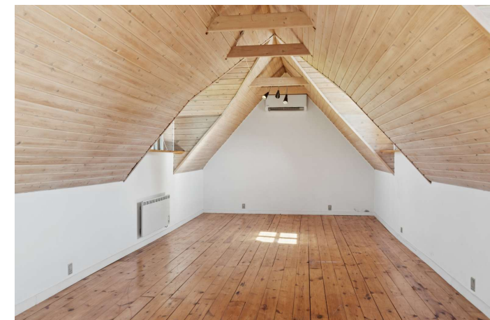
Gerlev Mose nr. 1A