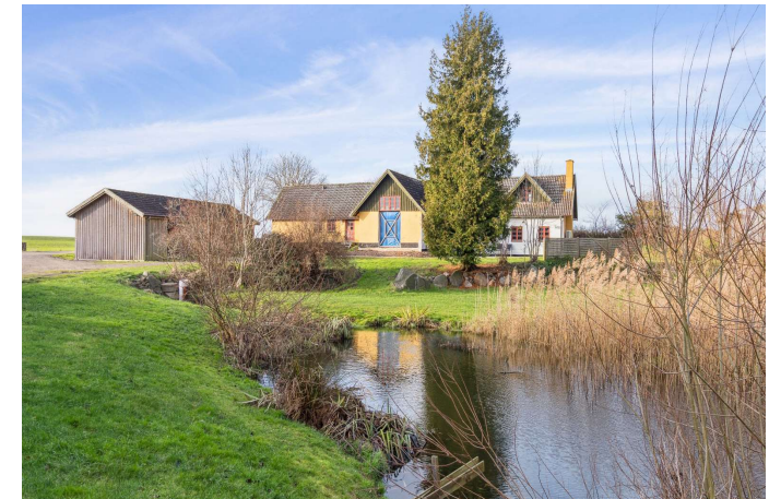
Gerlev Mose nr. 1A