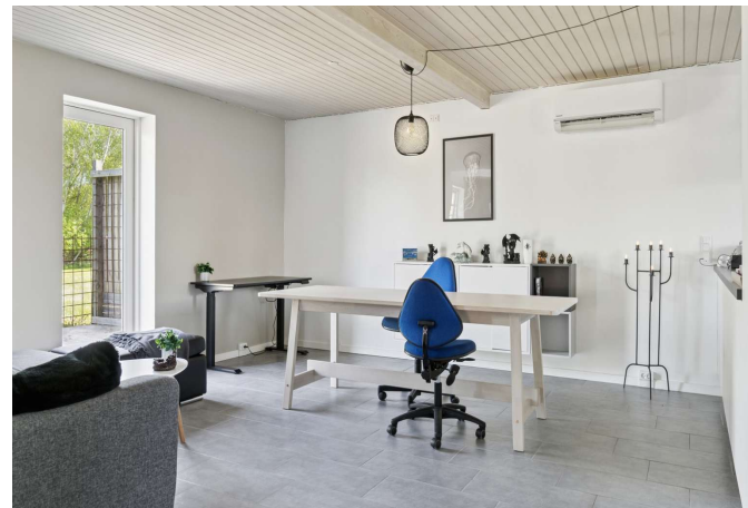
Gerlev Mose nr. 1B