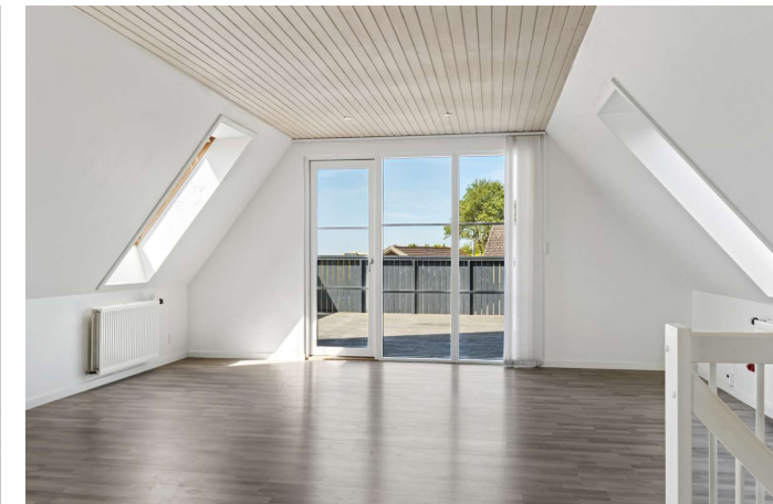
Gerlev Mose nr. 1B