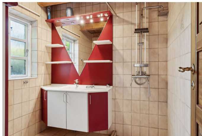
Gerlev Mose nr. 1A