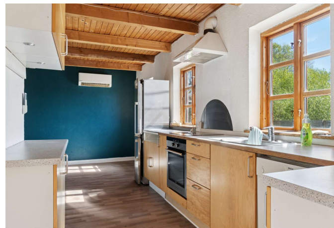
Gerlev Mose nr. 1A