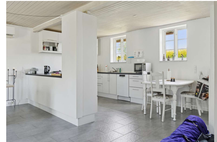
Gerlev Mose nr. 1B