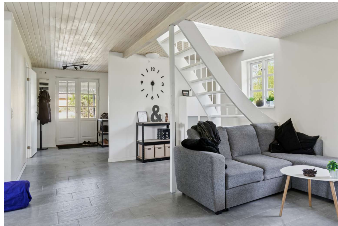
Gerlev Mose nr. 1B