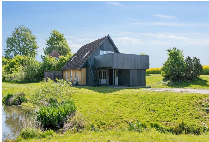
Gerlev Mose nr. 1B