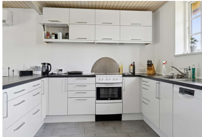
Gerlev Mose nr. 1B