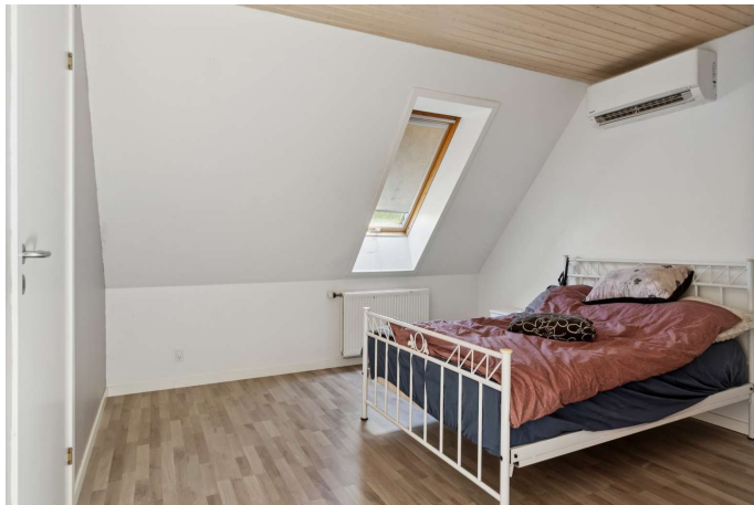
Gerlev Mose nr. 1B