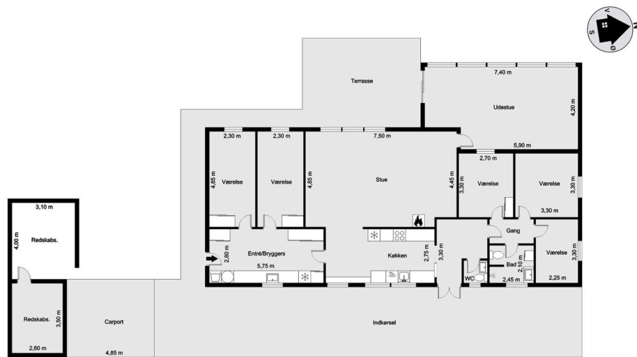
Vejledende tegning uden ansvar! (Profil.dk)