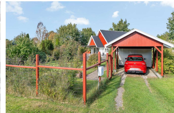
Set fra vejen